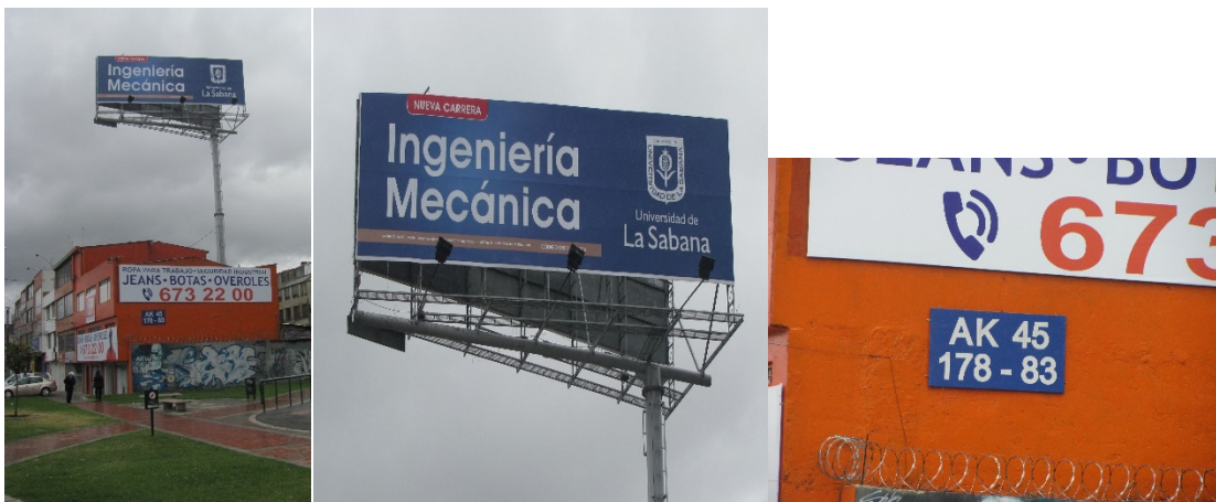
VISTA PANORÁMICA, DEL TABLERO DE LA VALLA Y NOMENCLATURA DEL INMUEBLE, SITIO ORIGINAL – AVENIDA CARRERA 45 No.178 – 83, SENTIDO NORTE – SUR, ANUNCIA: INGENIERÍA MECÁNICA UNIVERSIDAD DE LA SABANA