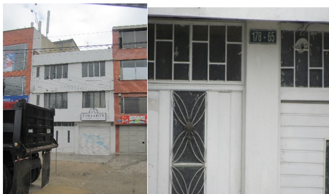
VISTA PANORÁMICA Y NOMENCLATURA DEL INMUEBLE – SITIO DEL TRASLADO – AVENIDA CARRERA 45 No. 178 – 65 – VALLA NO INSTALADA